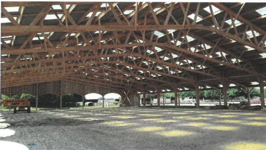
Châtaînet en cours au centre équestre Ranch Joshua - M. Vert-Le-Grand